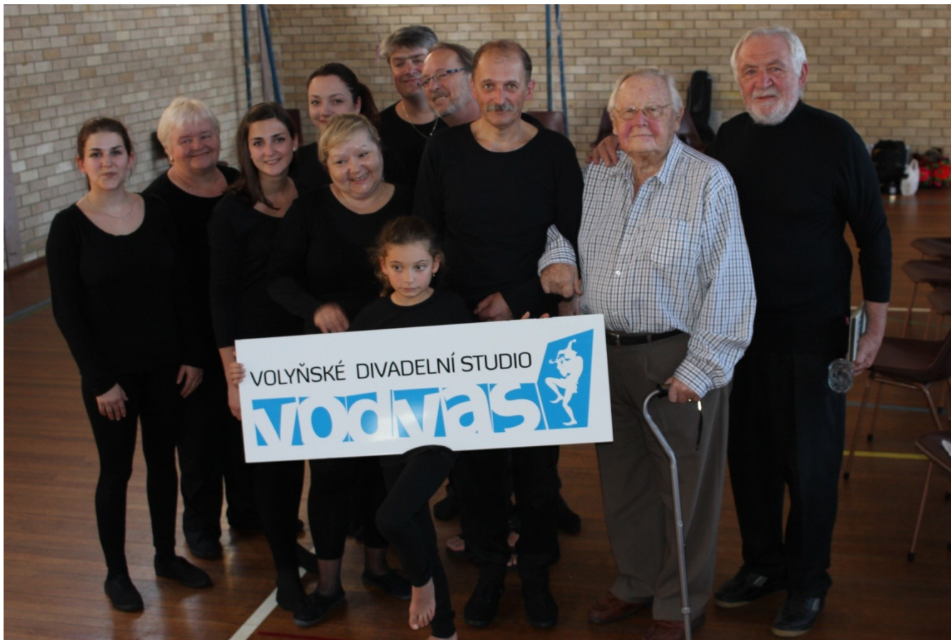
Bratr Šindler a Volyňané

Čím a kde a jak to nakousnout? Snad tou pohádkou „ O šíleně statečném Ivánkovi “ zahrnou v březnu v naší sokolovně. Představení sehráli zde hostující Volyňané – z Volyně v jižních Čechách zde hostující. Dostavil se poměrně slušný počet rodičů s dětmi a všem účinkujícím se dostalo zasloužené pochvaly častým potleskem.