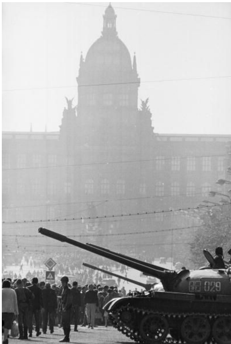
Sovětská invaze 21. srpna 1968

THE SOKOL SYDNEY PROGRAMME OF ACTIVITIES MAY BE HEARD ON 02 9452 5617