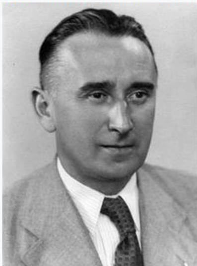
čs. ministr spravedlnosti