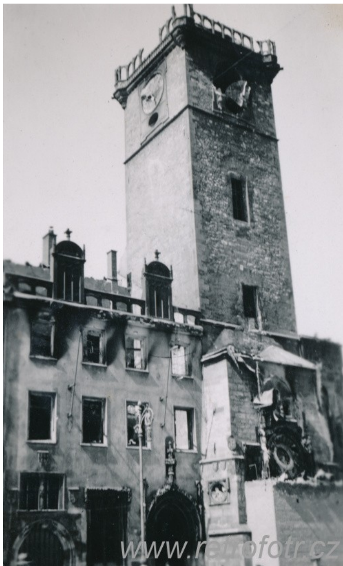
Květnová revoluce Praha 1945

THE SOKOL SYDNEY PROGRAMME OF ACTIVITIES MAY BE HEARD ON 02 9452 5617