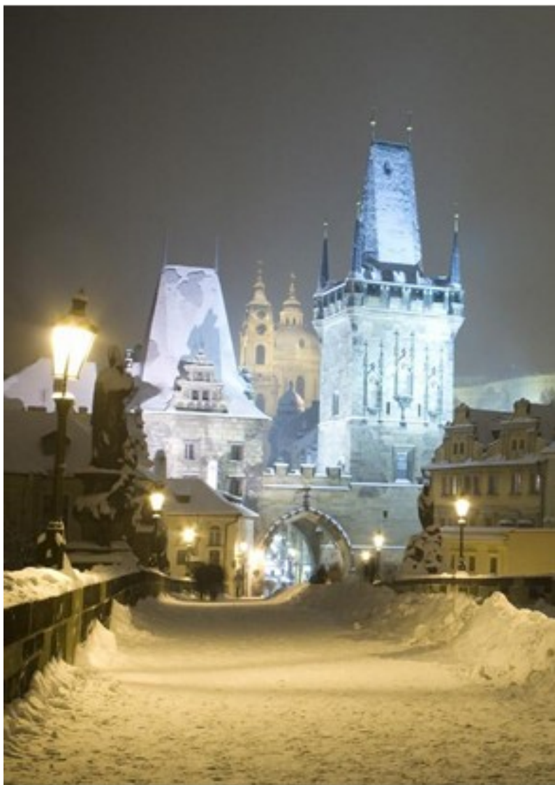
Zasněžená zimní Praha

THE SOKOL SYDNEY PROGRAMME OF ACTIVITIES MAY BE HEARD ON 02 9452 5617