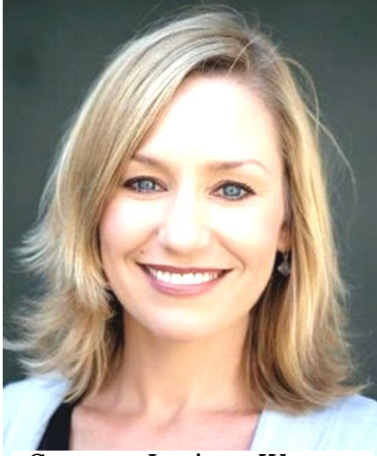
Senator Larissa Waters (Greens, Queensland)

"In the firing line are Barbie dolls for girls and toy trucks for boys, products Senator Waters said perpetuated negative social constructions."