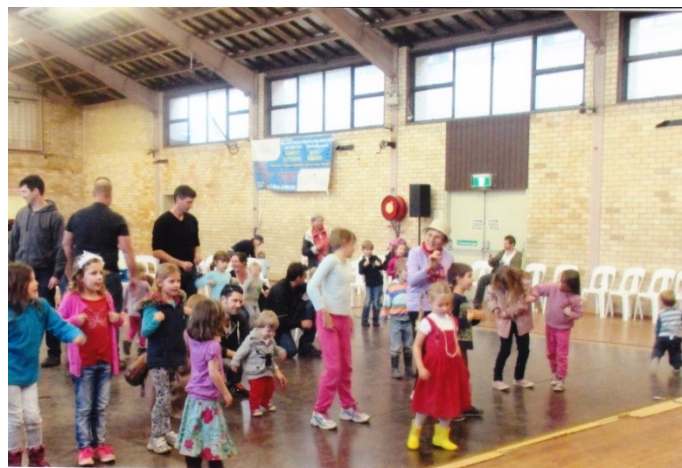
I obecnstvo tancovalo