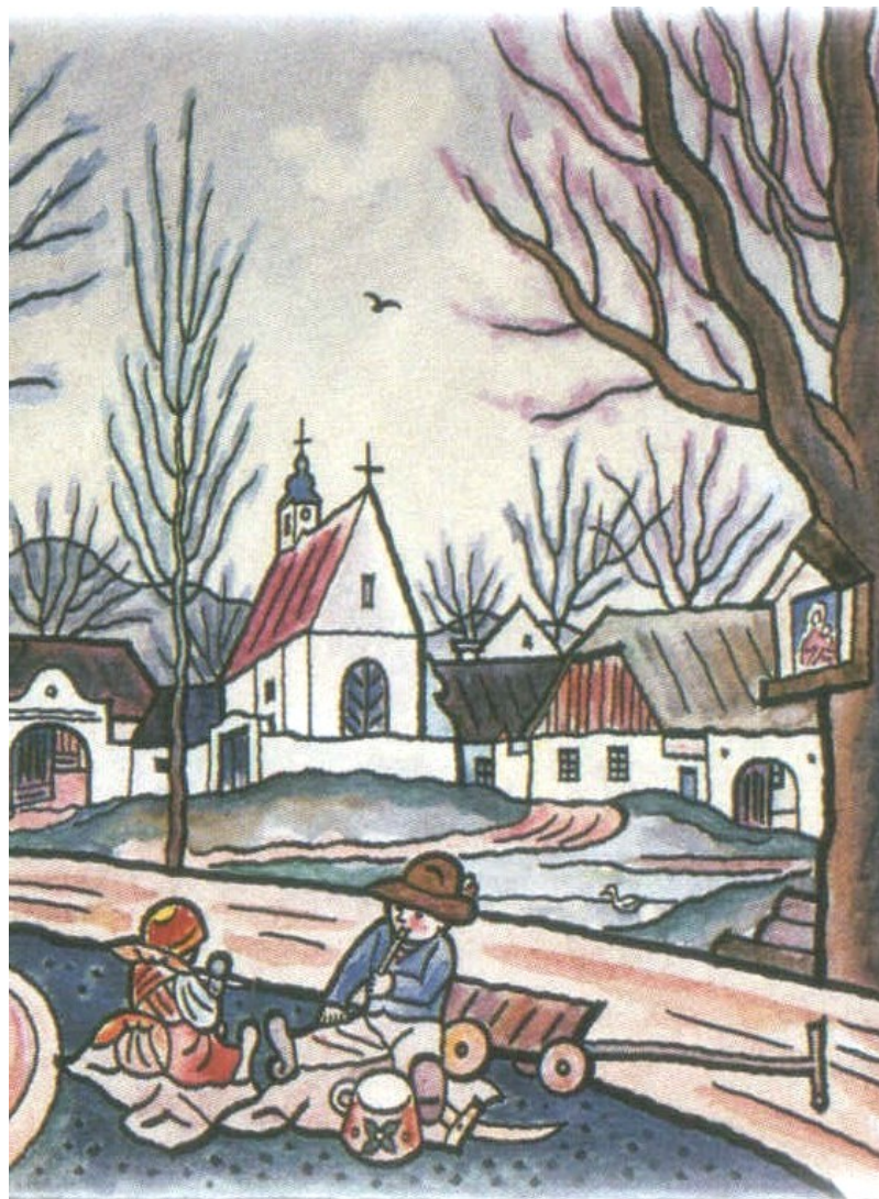
ŘÍJEN Josef Lada (výřez)

THE SOKOL SYDNEY PROGRAMME OF ACTIVITIES MAY BE HEARD ON 02 9452 5617