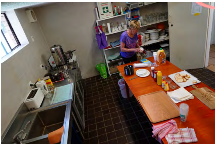
Přípravy v kuchyni začínají po 7.00 ráno