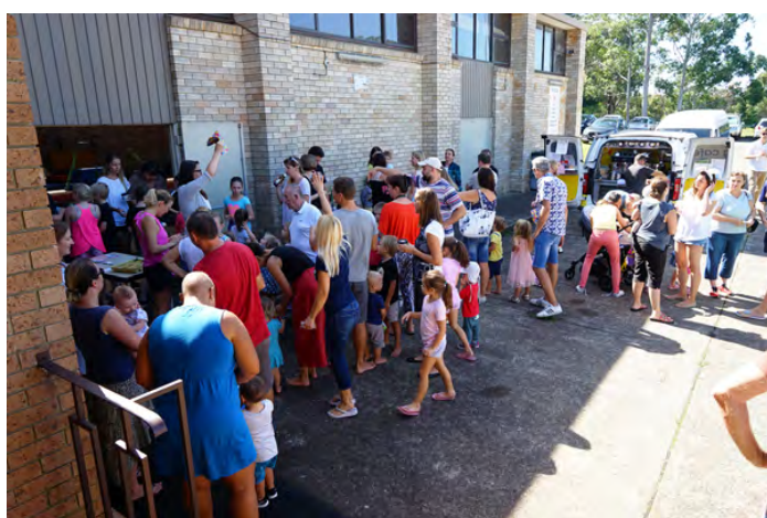
Dopolední káva a čekání na Egg hunt