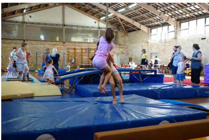
Za chvíli je ale tělocvična plná