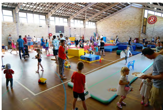
Hledání vajíček bylo hodně rychlé