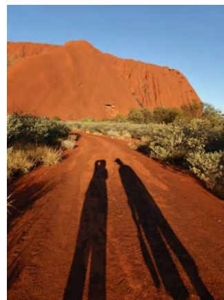
Snímky z výstupu na Uluru