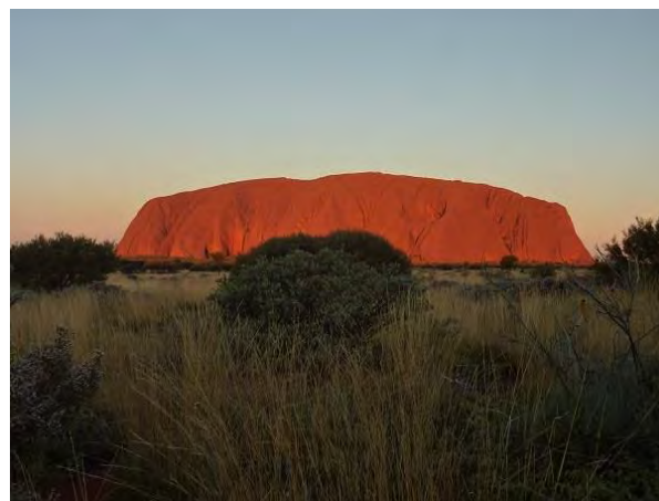
Posvátná hora ULURU