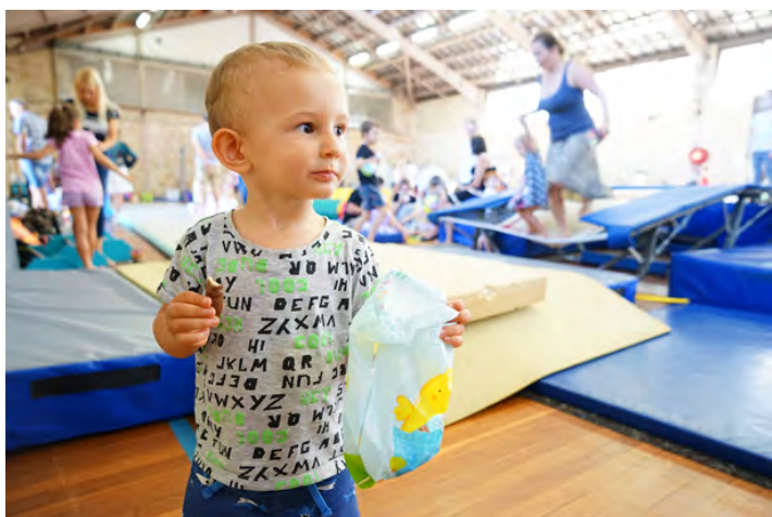
Úspěšný lovec čokolád