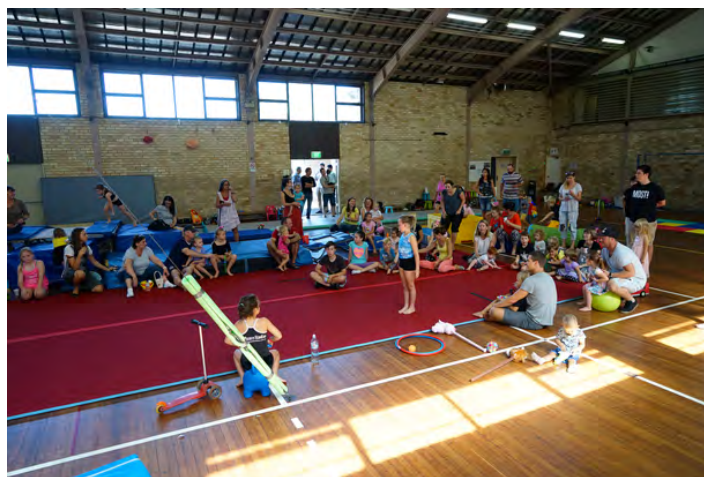
Představení mini gymnastics