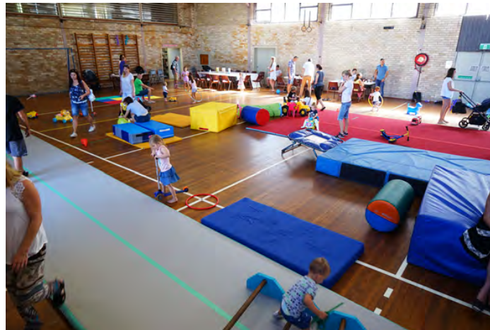
Účastníci se pomalu schází od 9.30